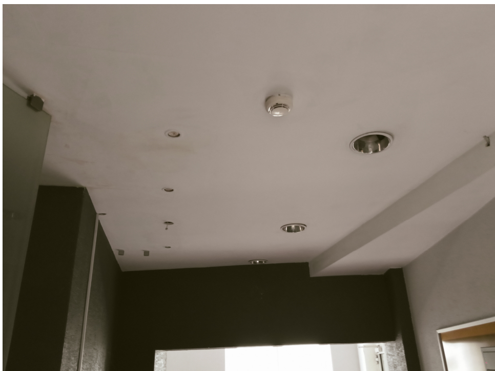
Fot 4. Widok sufitu podwieszanego w holu