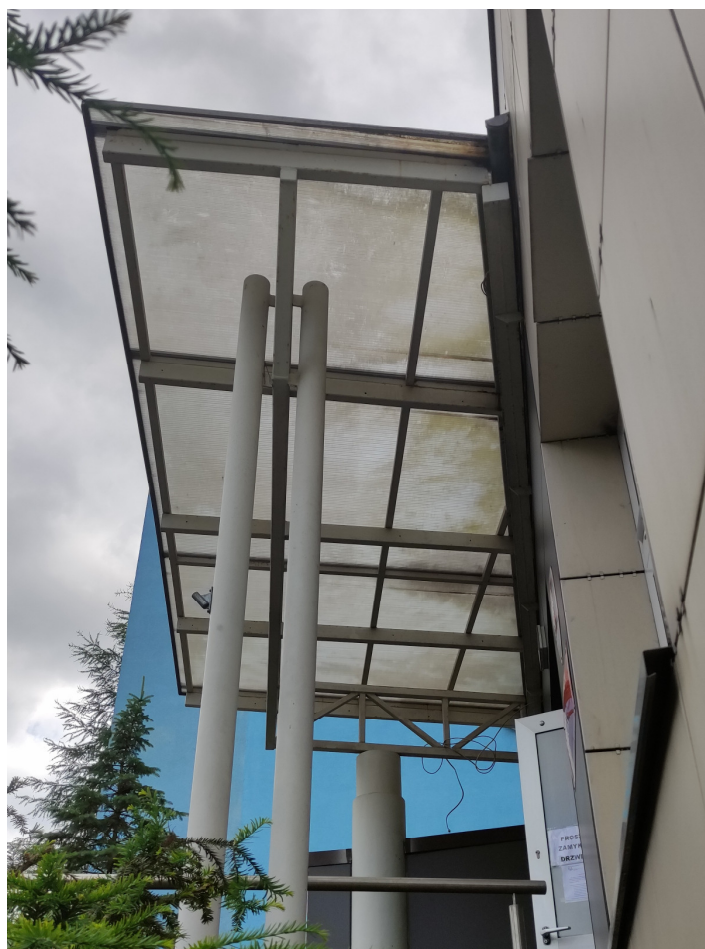
Fot 3. Widok boczny na zadaszenie