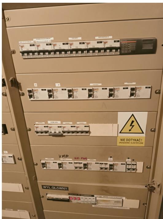
Fot 6. Widok rozd. TP-1

Należy rozbudować istn. rozdzielnicę o 3 wyłączniki różnicowo-nadprądowe jednofazowe: 2x B10 30mA typ AC – zabezpieczenie obw. oświetleniowych, 1x B16 30mA typ A – zabezpieczenie obwodu platformy schodowej.