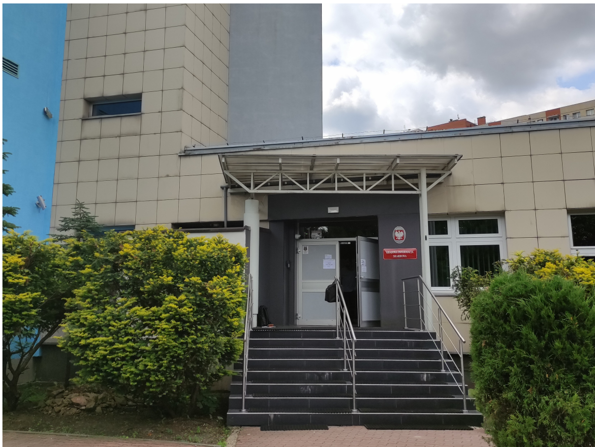
Fot 1. Widok ogólny wejścia głównego

We wnętrzu budynku, w pomieszczeniu holu wejściowego, znajduje się sufit podwieszany z płyt gipsowo-kartonowych, monolityczny, bez widocznej konstrukcji nośnej. Po lewej stronie od wejścia, nad dawną recepcją, występuje lokalne obniżenie sufitu – o nieregularnym pięciokątnym kształcie. W suficie wbudowane są oprawy oświetleniowe oraz inne elementy instalacyjne, w tym czujki instalacji sygnalizacji pożaru.