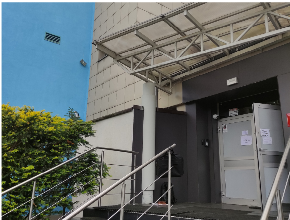
Fot 2. Wejście główne – zbliżenie