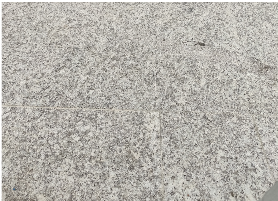
Fot 5. Zdjęcie poglądowe płyt granitowych przy wejściu głównym do Urzędu Skarbowego

Zastosować płyty o grubości 2,0 cm, montaż na kleju. Wykonać noski stopni o nadwieszeniu 1 cm oraz nadwieszenie nad ściankami bocznymi schodów o wysięgu 1cm.